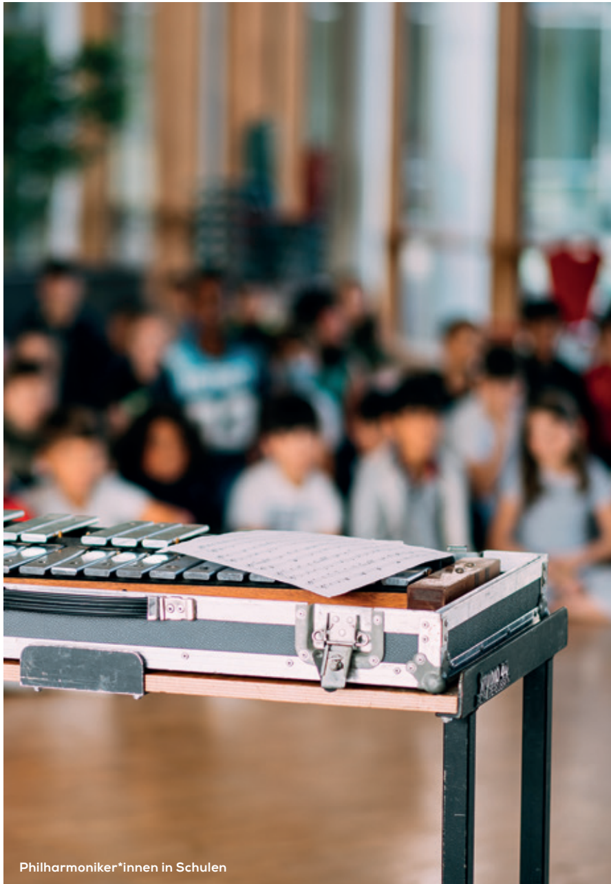
Philharmoniker*innen in Schulen

PhiSch ist nur buchbar in Verbindung mit dem Besuch eines Schulkonzertes, einer Opern-Vorstellung oder eines Probenbesuchs in der Oper.